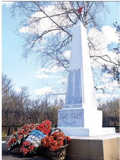
Обелиск в деревне Новокурьяново

Стелы и обелиски – одни из самых древних форм памятников в истории человечества. Вертикально стоящие каменные плиты с выбитыми знаками и именами устанавливали ещё в Древней Греции и Древнем Египте, поначалу в честь богов, а после – чтобы увековечить память о выдающихся людях или значимых событиях. На протяжении многих веков такие монументы устанавливали в разных частях света.