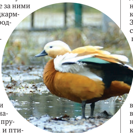
Мария СМЕРНОВА Фото автора

В апреле в парке микрорайона Остафьево появилась пара красных уток и сразу привлекла внимание местных жителей. Жители охотно и много фотографируют птичье семейство. К сожалению, вряд ли эти гости задержатся здесь надолго. К лету небольшой прудик в парке пересохнет, и птицам придётся искать новое место обитания.