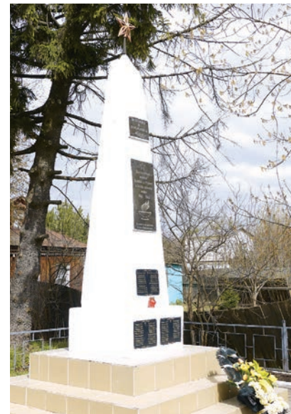
Обелиск в деревне Староникольское