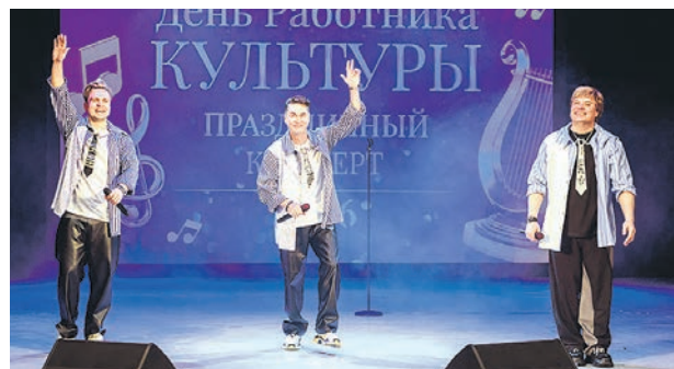
Выступление группы «На-на»

ры и школы искусств. Работа в этом направлении не останавливалась и, несмотря ни на что, будет продолжена. Спасибо вам за преданность делу, за искреннюю любовь к своей работе. Желаю вам вдохновения, новых творческих успехов, крепкого здоровья и благополучия! Защищая интересы людей, работаем для победы!» – отметил Герой России, депутат Государственной Думы Российской Федерации, член фракции «ЕДИНАЯ РОССИЯ» Дмитрий Саблин.